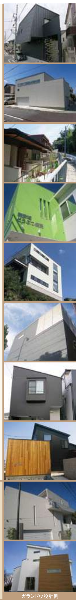
ガランドウ設計例

MSY-house 建築概要 ■住所／愛知県名古屋市緑区曾根3丁目2712番 ■用途地域／第2種中高層住居専用地域 ■敷地面積／99.54㎡ (34.98坪) ■延床面積／115.64㎡ (31.81坪) ■B1F:24.12㎡ (7.29坪) 1F:57.5㎡ (17.39坪) 2F:34.02㎡ (10.29坪) ■構造／木造軸組工法・直接基礎 ■規模／地下1階・地上2階建 ■ライフサワダ 担当・石原章行